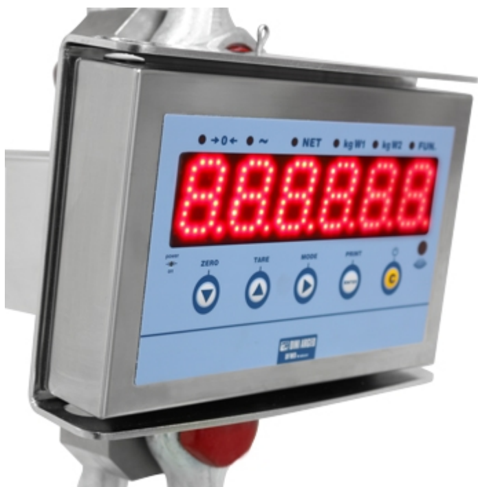
Dinamometro MCW09: display super-luminoso da 40mm