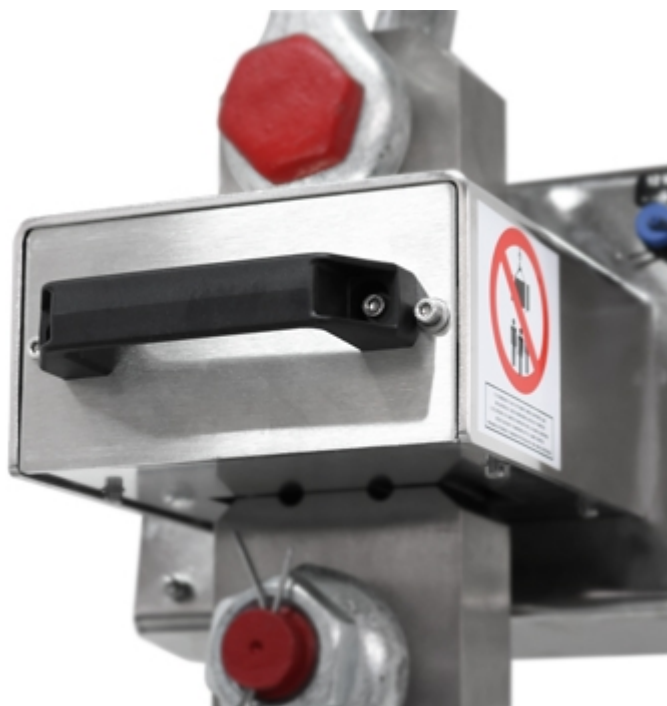
Dinamometro MCW09: dettaglio della batteria estraibile